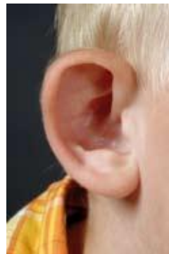
Voorbeeld van afwezige antihelix