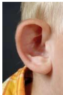
Voorbeeld van afwezige antihelix