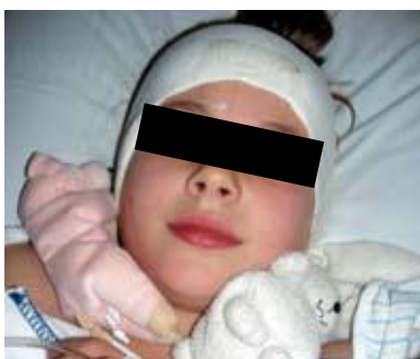
Typisch drukverband (direct na de operatie)

De reden voor dit lange natraject is dat wij willen voorkomen dat het oor 'terugklapt'.