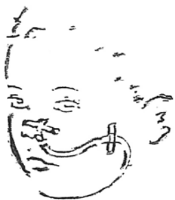
Figuur 3: Het vastplakken van de sonde.

Als de sonde niet goed vastgeplakt is, kan deze verschuiven en op de verkeerde plaats terecht komen. Uw kind kan hierdoor gaan spugen en/of zich verslikken of diarree krijgen.