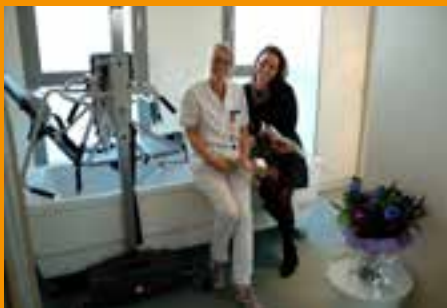
Meander Oncologisch Centrum werd ingericht met onder meer een palliatieve badkamer. Deze werd op 3 februari 2015, met het oog op Wereld Kanker Dag, officieel geopend.