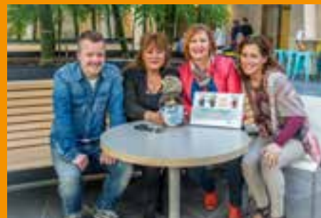
Eetlokaal de Noot uit Hoogland doneerde een blik met geld, gespaard met een speciaal Noodmenu. De opbrengst is voor het muziekproject voor mensen met een beroerte.