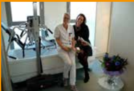
Meander Oncologisch Centrum werd ingericht met onder meer een palliatieve badkamer. Deze werd op 3 februari 2015, met het oog op Wereld Kanker Dag, officieel geopend.