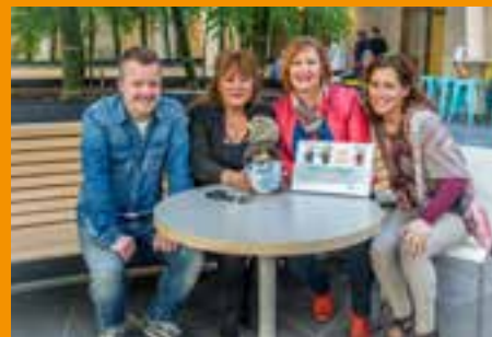
Eetlokaal de Noot uit Hoogland doneerde een blik met geld, gespaard met een speciaal Noodmenu. De opbrengst is voor het muziekproject voor mensen met een beroerte.