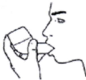
Plaatje 2, vasthouden van de Shaker.