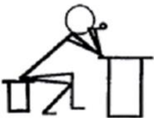
Plaatje 1, zithouding.

U kunt de trillingen aanpassen door harder of zachter te blazen. Als u de Shaker een beetje naar boven kantelt (door het uiteinde iets op te tillen) nemen de weerstand en de trillingen toe. Hierdoor heeft de Shaker meer effect.