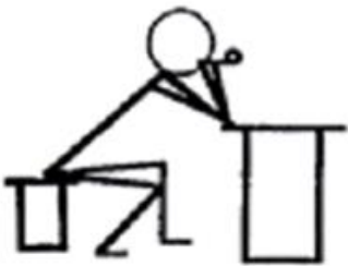
Plaatje 1, zithouding.

U kunt de trillingen aanpassen door harder of zachter te blazen. Als u de Shaker een beetje naar boven kantelt (door het uiteinde iets op te tillen) nemen de weerstand en de trillingen toe. Hierdoor heeft de Shaker meer effect.